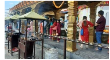
Le Népal, 14j en novembre