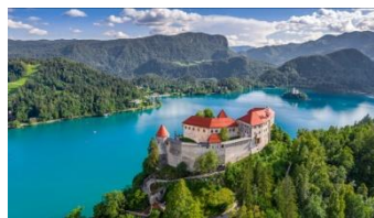
La Slovénie, 8j en septembre