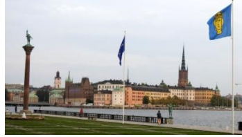
Stockholm, 4j en septembre