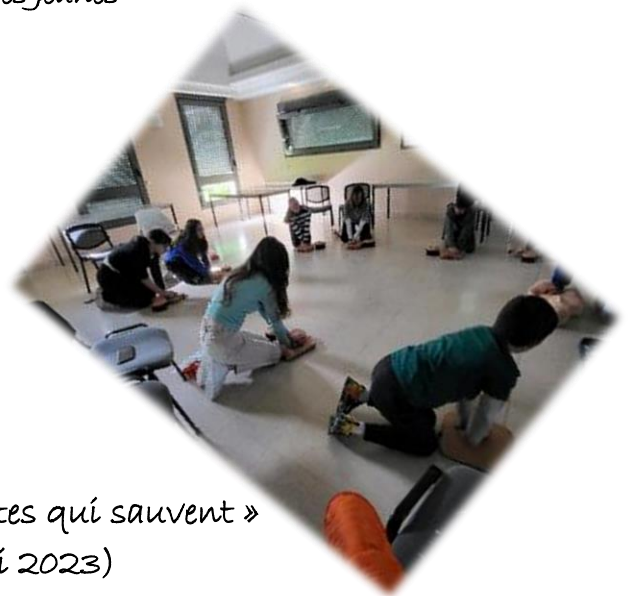
Formation « Gestes qui sauvent » (13 Mai 2023)