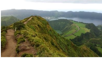
Les Açores, 8j en juin