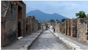
Naples/Pompéi, 5j en mai